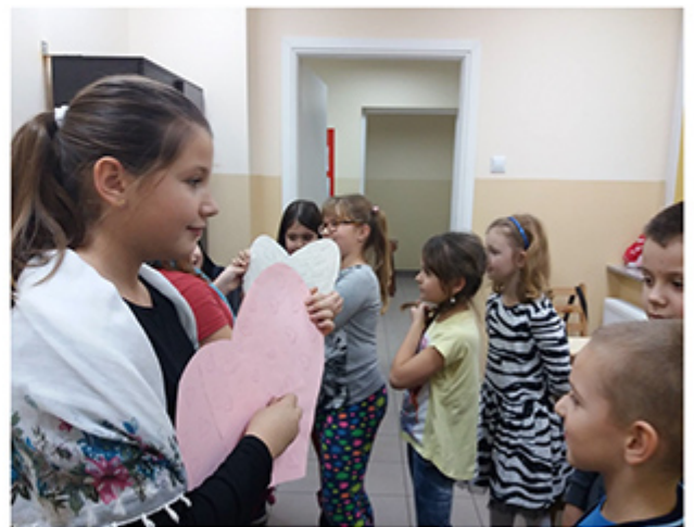
Tekst: GOK w Zakroczymiu

Świetlica w Janowie, która działa w ramach Gminnego Ośrodka Kultury proponuje dzieciom następujące zajęcia: plastyczne, podczas których dzieci kształtują estetykę, rozwijają wyobraźnię oraz kreatywność. Czytelniczo-teatralne, na których dzieci ćwiczą emisję głosu, werbalne i niewerbalne formy komunikacji oraz poznają twórczość różnych autorów, świetlicowe, na których dzieci poznają atrakcyjne formy spędzania czasu wolnego: zabawy ruchowe, gry planszowe, zabawy integrujące grupę rówieśniczą realizowane poprzez szeroko rozumianą gryfikację. Ponadto dzieci zawsze mogą liczyć na pomoc w odrobieniu pracy domowej, z czego chętnie korzystają. W świetlicy organizowane są, oprócz zajęć stałych, wyjątkowe imprezy okolicznościowe dla dzieci np. Andrzejkki, a w najbliższych planach zabawa sylwestrowa i karnawałowa.