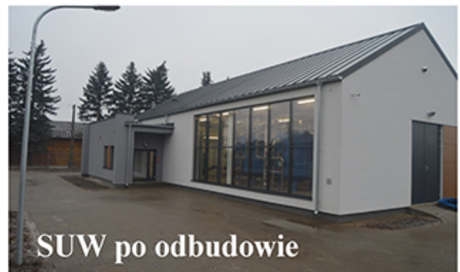
SUW po odbudowie