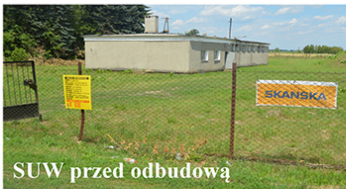
SUW przed odbudową