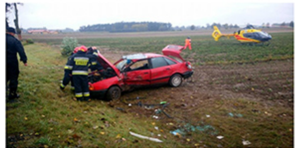
Tekst: Witold Młynarski - Naczelnik OSP Trębki Nowe

Jednostka OSP Trębki Nowe od 2010 r. jest włączona do KSR 6, zrzeszonych jest w niej 36 członków-przeszkolonych strażaków. Na wyposażeniu posiada 2 samochody pożarnicze średnie DAF i STAR 244 oraz samochód operacyjny marki Polonez. Jednostka W 2016 r. brała udział w 38 wyjazdach, w tym 25 wyjazdów było do gaszenia pożarów budynków, traw oraz wypadków drogowych natomiast 13 wyjazdów do usuwania drzew z budynków oraz dróg.